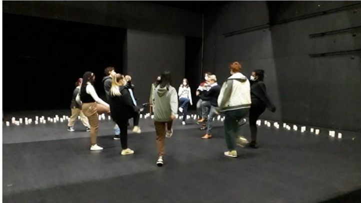
Planche d'images n°1 : le temps de l'échauffement

L'échauffement est tantôt suivi d'exercices de groupe qui favorisent le développement des compétences psychosociales, tantôt d'exercices individuels qui permettent plutôt de travailler les compétences orales. Plusieurs exercices proposés aux élèves pour développer l'un, l'autre ou les deux types de compétences sont présentés dans le tableau ci-dessous et illustrés par la planche d'images n°2. Dans presque tous les cas, les exercices proposés permettent de travailler la gestion du stress et des émotions dans la mesure où elle conduit presque systématiquement les élèves à s'exposer et prendre des risques.