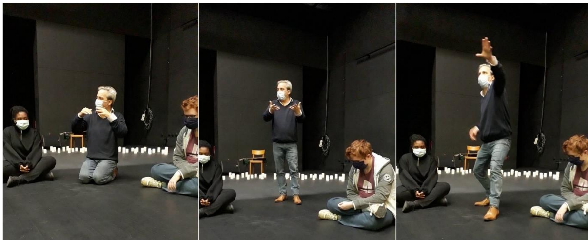
Planche images n°3 : le temps du débriefing

Chaque exercice est suivi d'un débriefing (planche d'images n°3) qui a rencontré un grand succès auprès des élèves dès lors qu'il était personnalisé et valorisait les points positifs de la prestation de chacun avant d'évoquer les pistes d'amélioration.